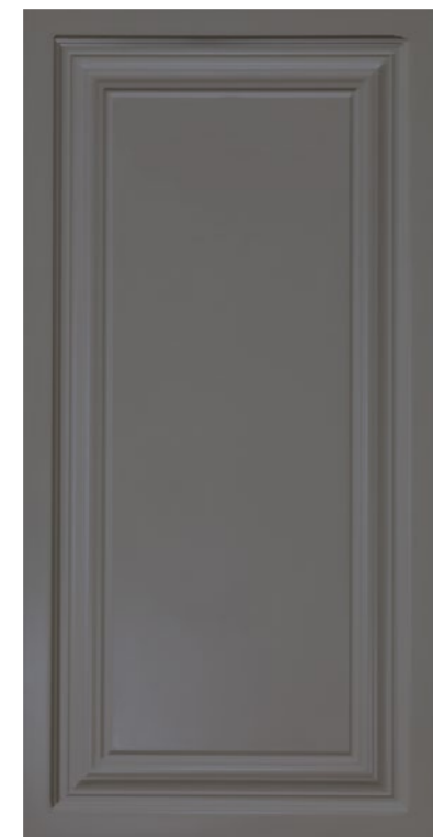
■ Pannello 40x80 cm cod. 332