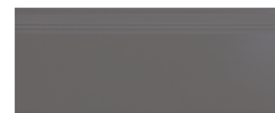
■ Battiscopa 16x40 cm cod. 325