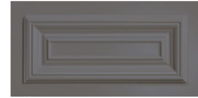
■ Cassettone 20x40 cm cod. 326