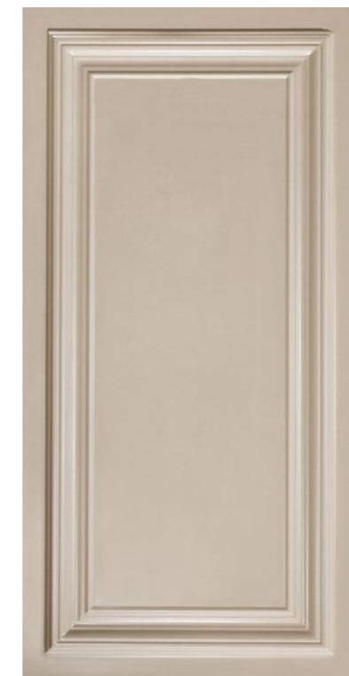
■ Pannello 40x80 cm cod. 332