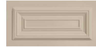
■ Cassettone 20x40 cm cod. 326