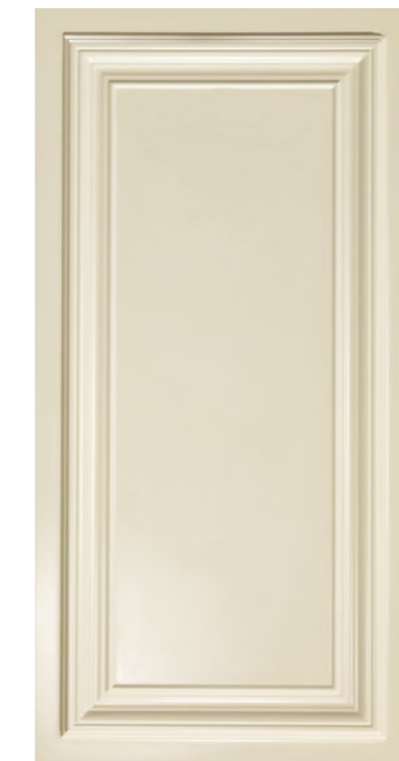
■ Pannello 40x80 cm cod. 332