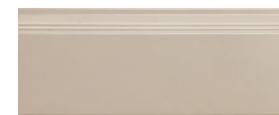
■ Battiscopa 16x40 cm cod. 325