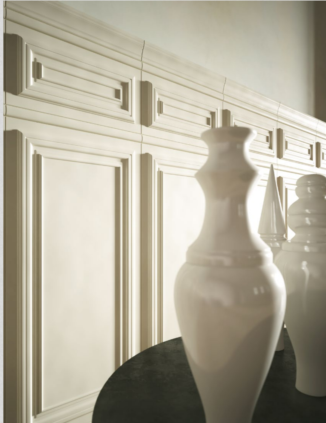
800 Italiano Bianco