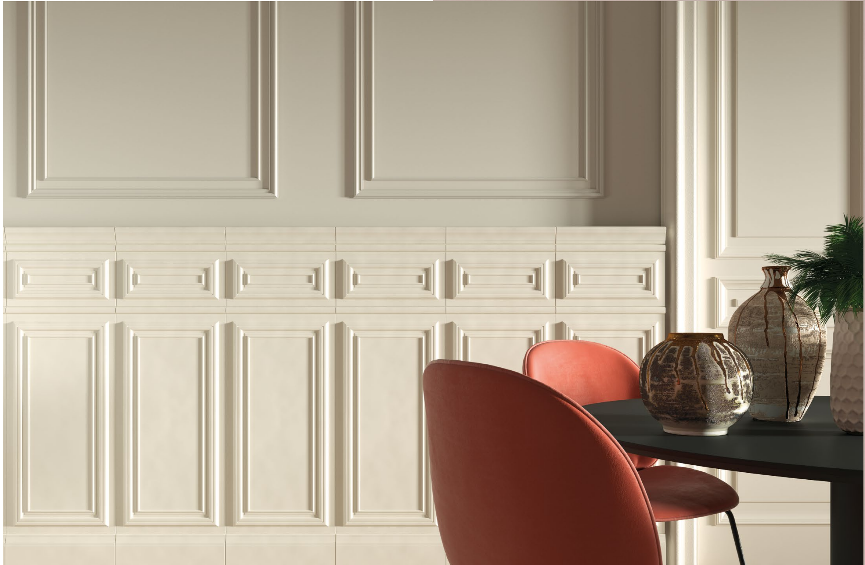
800 Italiano Bianco