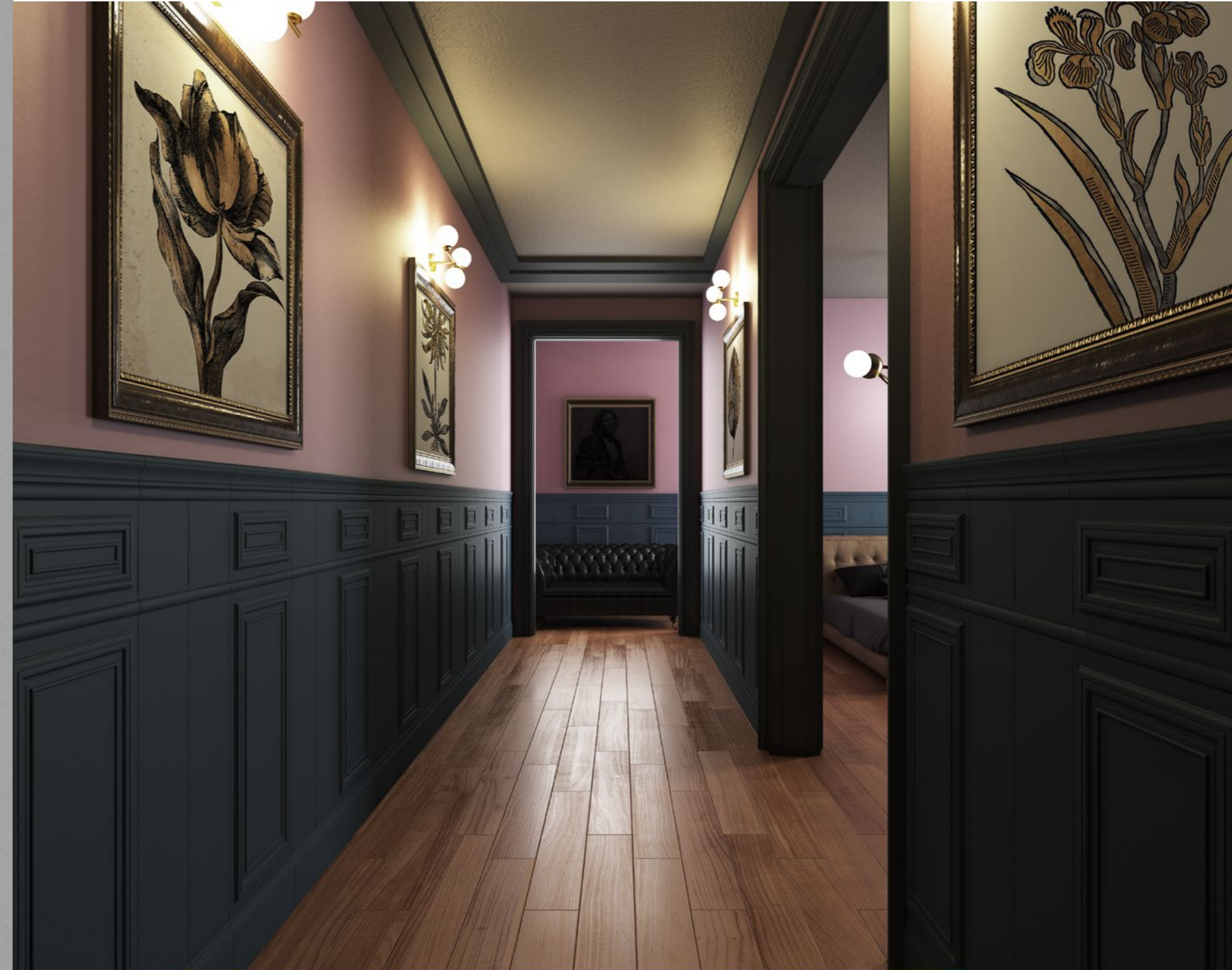
800 Italiano Blu Reale