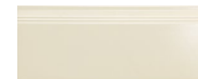
■ Battiscopa 16x40 cm cod. 325