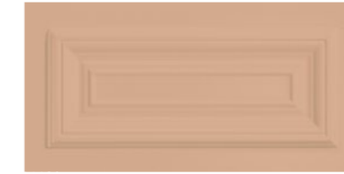
■ Cassettone 20x40 cm cod. 326 Cipria