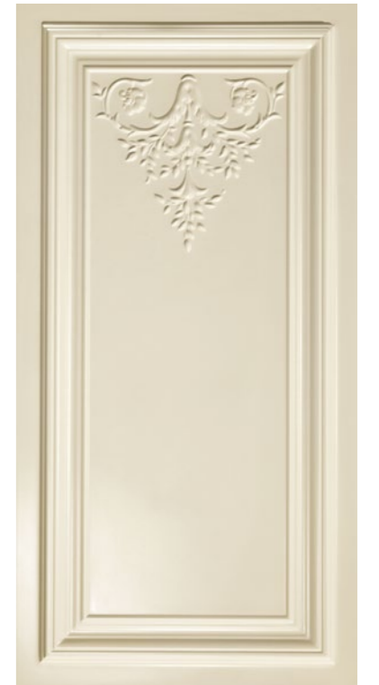
■ Pannello 40x80 cm cod. 332