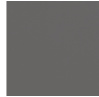
■ Fascia Riposo liscia 20x20 cm cod. 204