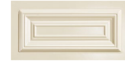
■ Cassettone 20x40 cm cod. 326