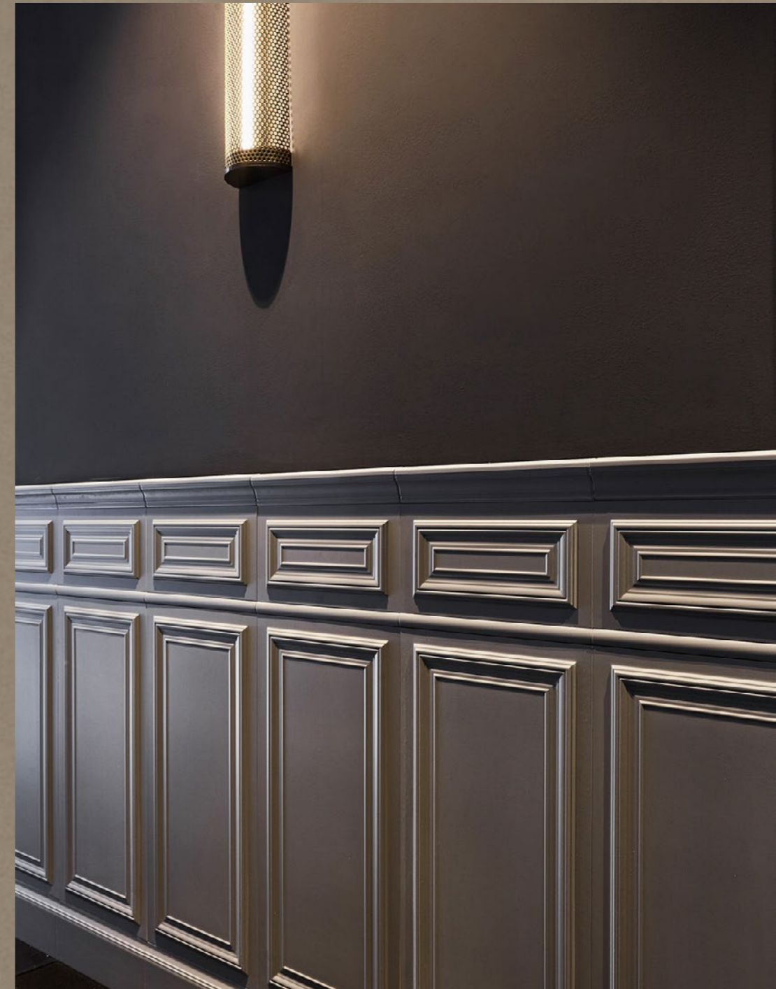
800 Italiano Grigio Visone

800 Italiano by Petraccer's is the absolute synthesis between style, refinement, aesthetics and for this reason it stays on the scene, going beyond the ages, to position itself in a timeless dimension.