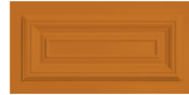
■ Cassettone 20x40 cm cod. 326 Cognac