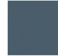
■ Fascia Riposo liscia 20x20 cm cod. 204