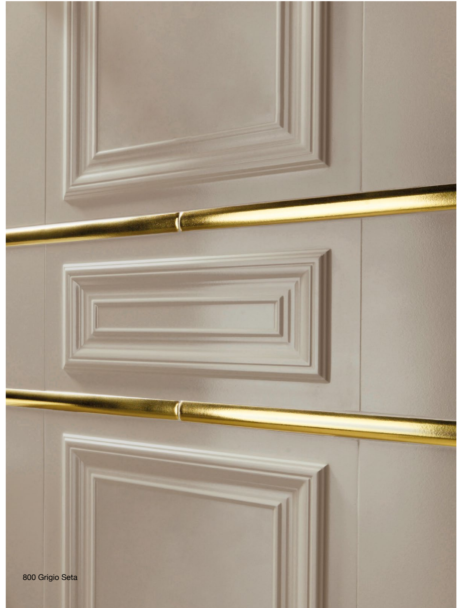
800 Grigio Seta