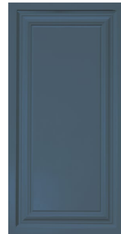
■ Pannello 40x80 cm cod. 332