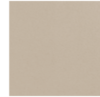
■ Fascia Riposo liscia 20x20 cm cod. 204